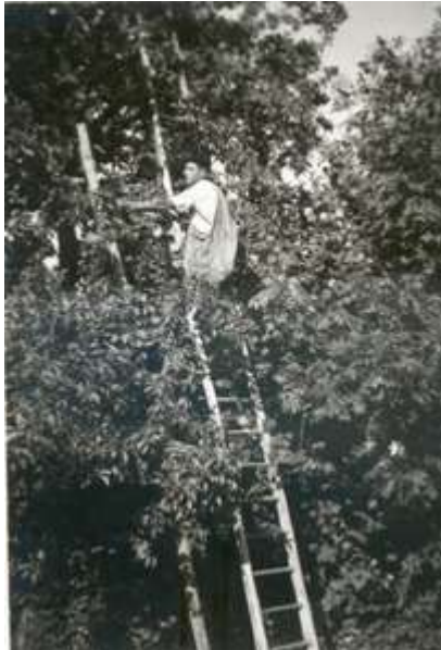
Il y a 40 ou 50 ans

De nos jours, on cueille encore la pomme de plein vent, non sans danger.