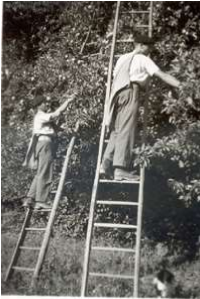
A la Royauté, il y a 40 ou 50 ans